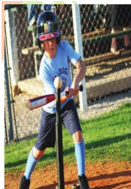
Igra za otroke od 6 do 12 let

Tee ball je eden redkih kolektivnih športov, namenjen tej starostni kategoriji, skupaj deklicam in dečkom, ki se lahko izvaja na vsaki ravni površini, v prostoru ali v naravi in je z vsemi elementi igre odlična osnova za vse ostale športe.